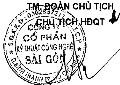
Đặng Công Ngôn